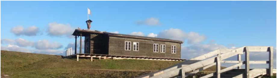
Notgalerie – ehemalige Kirche St. Josef am Ulanenweg

In der Notgalerie – es handelt sich um eine ehemalige Kirche unserer Pfarre: St. Josef am Ulanenweg – beschließen wir die Lange Nacht der Kirchen 2019 in der Seestadt etwa um 23:00 Uhr mit einem Segensgebet.