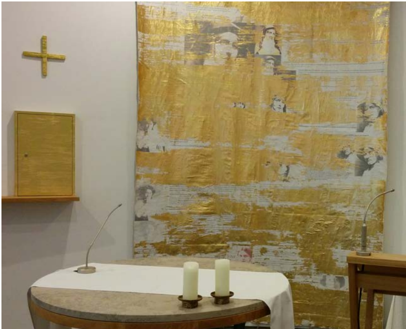
Altarbild von St. Edith Stein

Der Künstler Briant Rokyta stellt sein Altarbild vor, das der Heiligen Edith Stein gewidmet ist. Die ersten 30 Besucherinnen und Besucher erhalten als Geschenk ein künstlerisches Unikat aus dem Entstehungsprozess dieses Bildes!