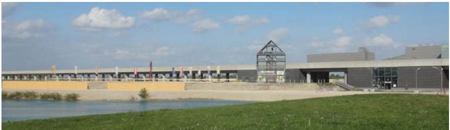
Der Campus der Religionen (Fahnenfeld links) und das Flederhaus

Tip: Worship und Anbetung mit WePraise um 20:00 Uhr in St. Edith Stein