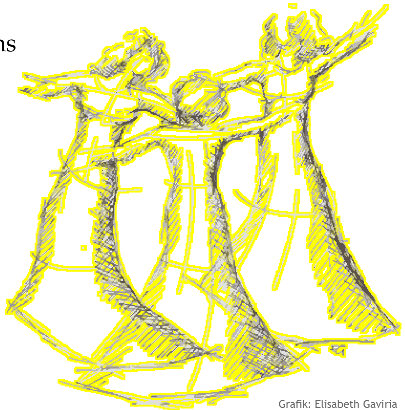
Grafik: Elisabeth Gaviria