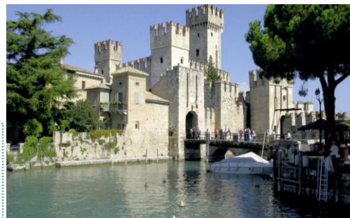
Wasserburg in Sirmione

Leistungen: Busfahrt lt. Programm inklusive Mauten und Parkgebühren, Unterbringung im ***Hotel Porta Palio, 4 x Nächtigung/ Frühstücksbuffet, Quiet-Vox-Geräte für alle 5 Tage, 3 x örtliche Guides (je ein Halbtage in Verona, Mailand und Padua), Eintritt in die Scrovegni-Kapelle, Einfahrtsgenehmigung in Verona