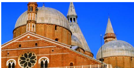
Basilika S. Antonio Padua

5.Tag: Verona - Padua (Rundgang: Universitätsviertel, Basilika Sta. Giustina, Palazzo Raggione und Rathaus, St. Antonius-Basilika, Scrovegni-Kapelle mit Giotto-Fresken) – Kanaltal – Wien